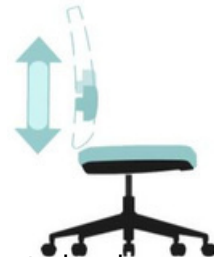
Soporte lumbar con altura regulable