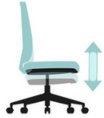
Ajuste de altura del asiento