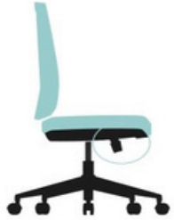
Ajuste de tensión de inclinación