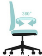
Asiento giratorio sobre 360°