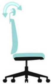
Ángulo regulable del reposacabezas