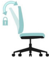
Reclinación del respaldo con traba en posición de trabajo