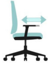
Brazos deslizan hacia adelante y hacia atrás