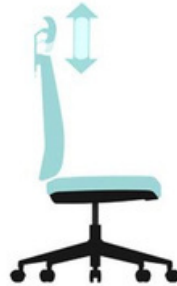
Altura regulable del reposacabezas