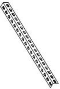
A- Angulo (8 pcs)

Por favor lea completamente - las instrucciones y verificar que todas las piezas de la lista están presentes antes de comenzar el montaje