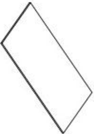
D. (5 pcs)