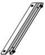
C- Soportes (10 pcs)